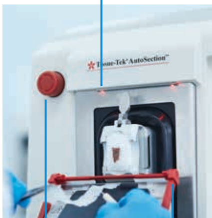
Luces LED rojas